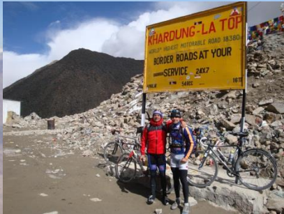
Khardung La (5.602m)