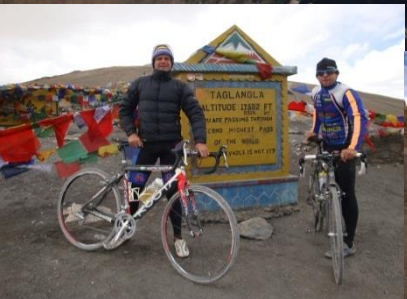
Taglang La (5.328m)