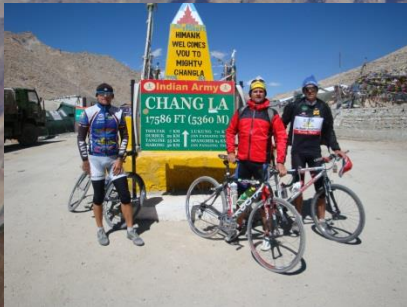
Chang La (5.360m)